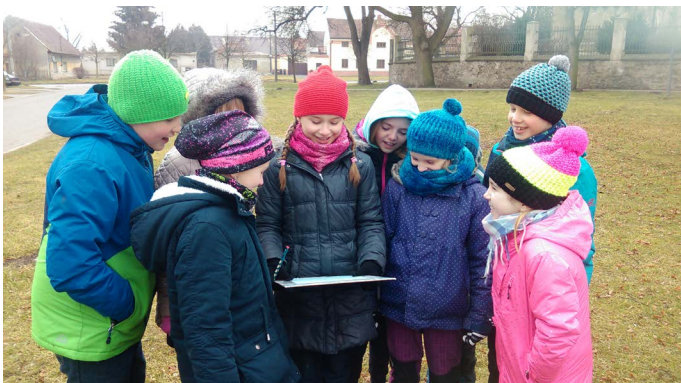
ZŠ Prosperity - anketa v obci