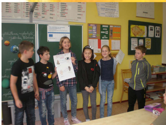
ZŠ Libchavy - Tvorba smyslových plakátů