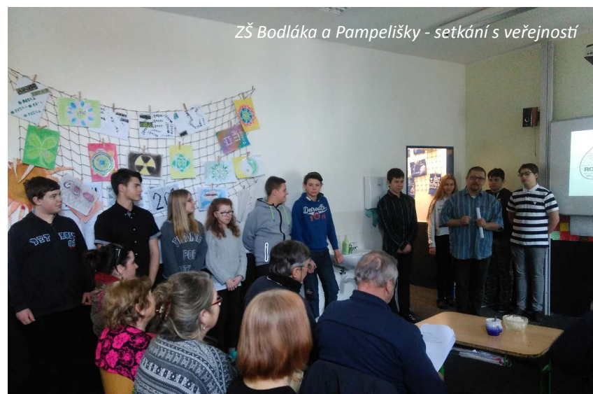
ZŠ Bodláka a Pampelišky - setkání s veřejností