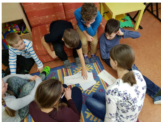
ZŠ Lukavice - nastavení pravidel komunikace a spolupráce