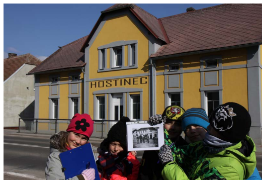
ZŠ Stěžery - tématické výuka - putování časem