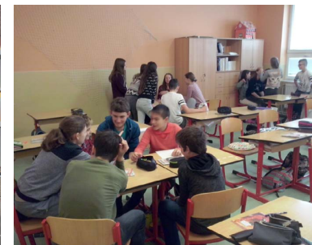
ZŠ Pěnčín - nácvik facilitace