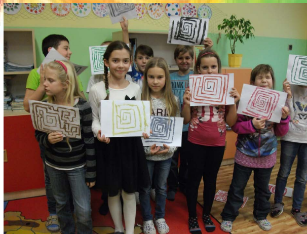
ZŠ Višňová - motivace - kreslení labyrintů